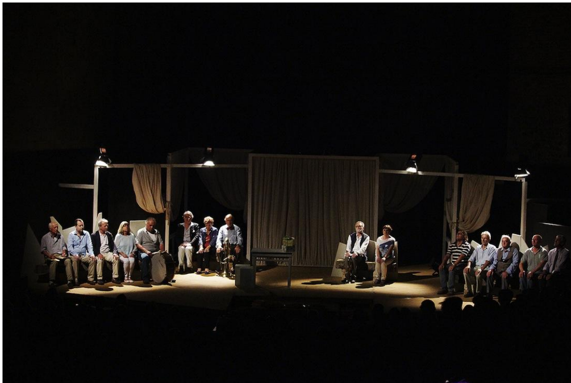
Il paese che manca – foto: Edoardo Agnoletti

Venendo all'“autodramma” (la definizione è di Giorgio Strehler) di quest'anno, dal titolo emblematico Il paese che manca , lo spunto è il ventesimo compleanno dell'ultimo ragazzo rimasto in paese. Un momento di riflessione per tutta la comunità. Il toscano arcaico della nonna introduce la vicenda nella prima scena, fatico a comprendere alcune parole nonostante la lingua sia vicina alla mia. Penso alla mia, di nonna, e comprendo come i piccoli grandi temi che vengono affrontati non siano sentenze ma spunti di riflessione : nuove generazioni e nuove tecnologie, l'ufficio postale del paese che chiude, emigrazione e immigrazione. Mentre i giovani toscani vanno a Londra o a Berlino molti altri giovani vengono dall'estero in Italia e fare i lavori che gli italiani non vogliono fare più.