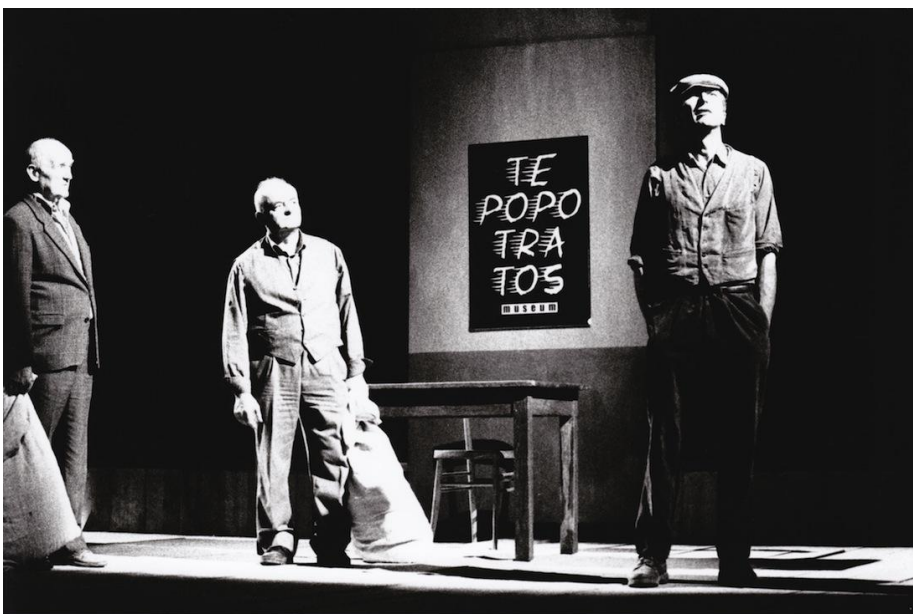
Tepoptratos Museum (2002)

L'ultima volta che ero stato a vedere il Teatro Povero di Monticchiello era il 2002, in quegli anni, come si evinceva dallo spettacolo Tepoptratos Museum , il timore degli abitanti/attori del borgo toscano era quello di non diventare un "museo vivente" . Per esorcizzare questa paura nacque l'anno dopo il vero museo , che ho visitato poco prima dello spettacolo. Il museo interattivo si trova nel granaio accanto alla chiesa. Il granaio è anche sede della cooperativa del Teatro Povero.